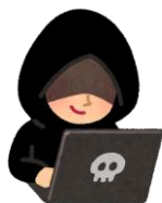
攻撃者 (A社の なりすまし)