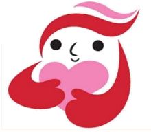
犯罪受害者等支援 象征性图案 「ギュッとちゃん」

二十四小时都可咨询 ※ 星期一到星期五 上午九点到下午五点四十五分之间 由女性职员应对