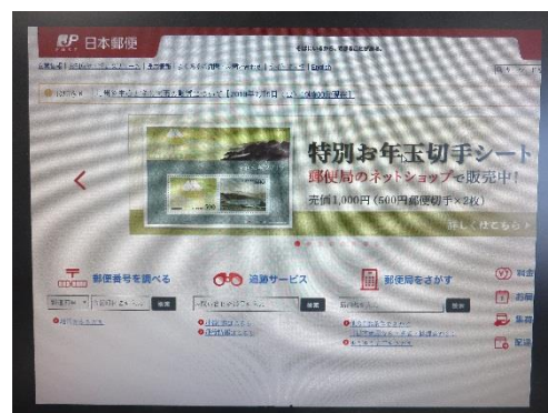
誘導先の偽サイトの画面 (例)