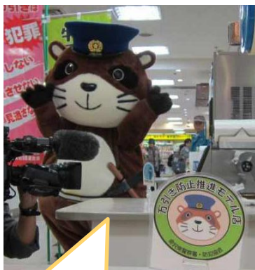
金沢東警察署マスコット ぽん太くん

マスコットキャラクターと一緒に、万引き防止を訴えるポケットティッシュの配布等を行いました。